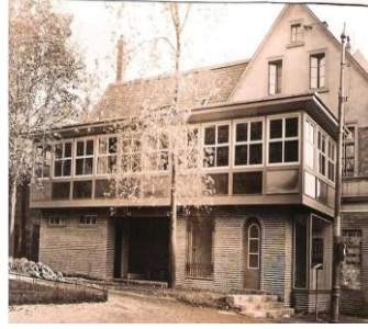
Das berühmte Café Pipi

Der Verstorbene gehörte lange Jahre dem BVO an.