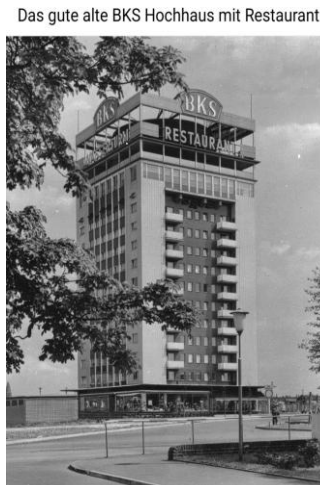
Das gute alte BKS Hochhaus mit Restaurant