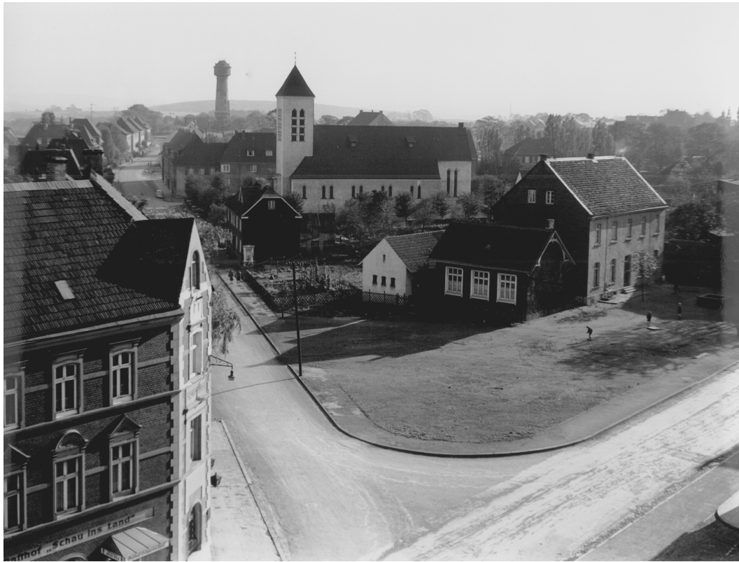
"Platz an der Kuhlendahler Straße", heute "Kirchplatz" mit Gasthof "Schau ins Land", Volksschule, katholischer Kirche und Wasserturm in den 50er Jahren